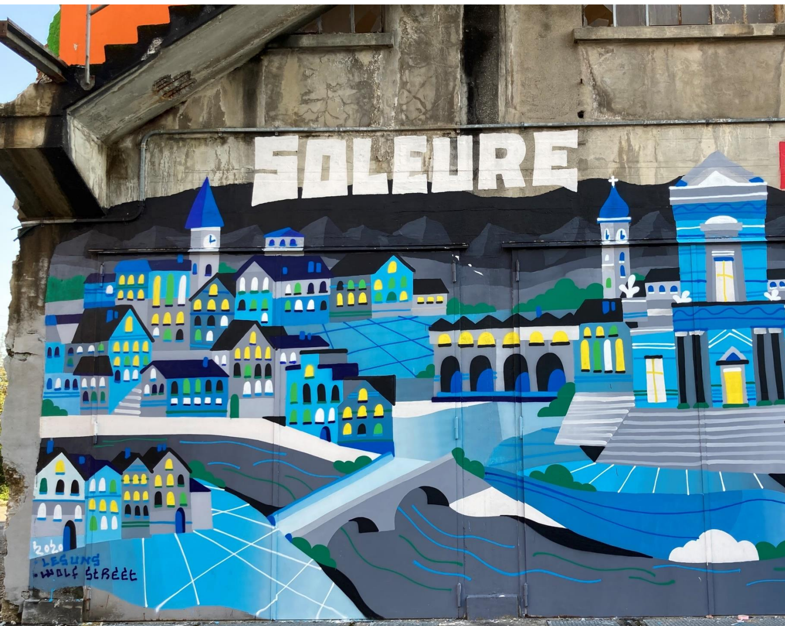
Graffito Soleure auf dem Schlüsselareal Attisholz in Riedholz