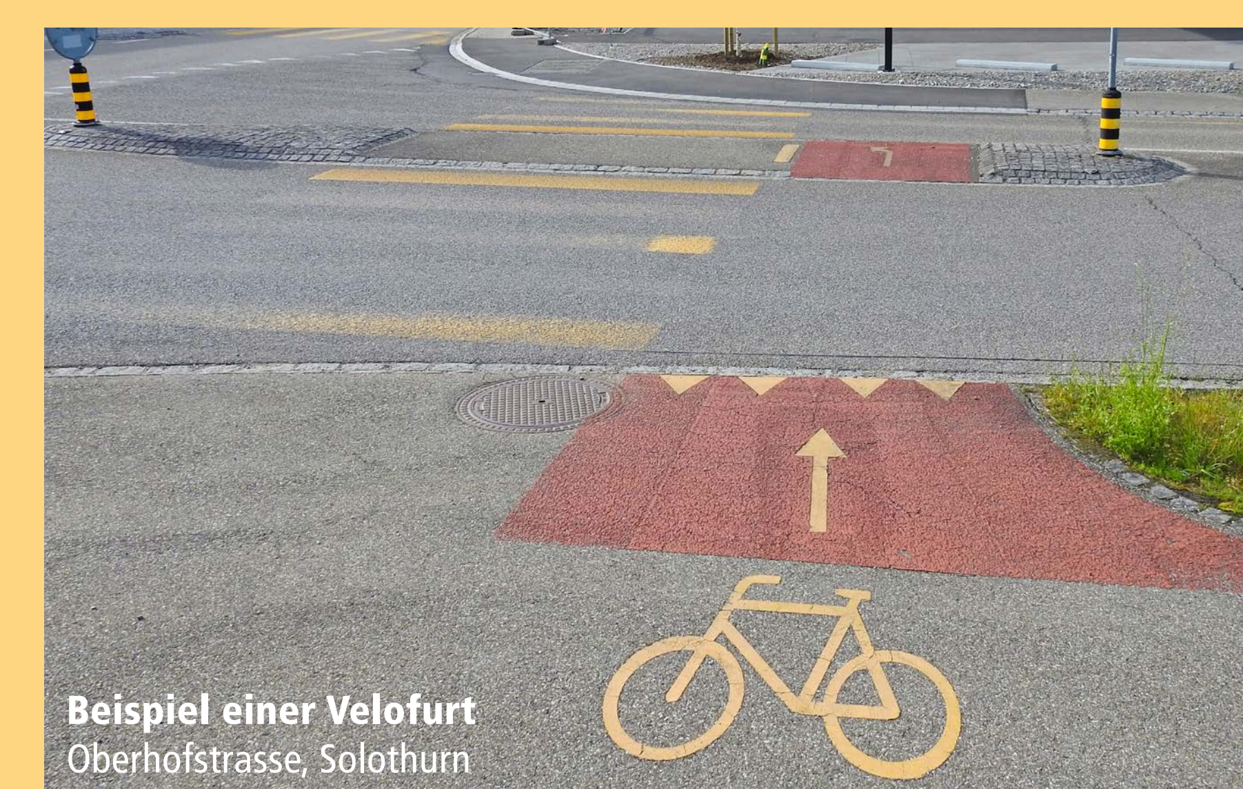
Beispiel einer Velofurt Oberhofstrasse, Solothurn

Zum Queren der Bielstrasse werden bei beiden Kreisell auf beiden Seiten Velofurten erstellt, ohne Ansätze im Bereich der Mittelinseln. Im Gegensatz zum Fussgängerstreifen erhalten Velofahrende hier jedoch keinen Vortritt.