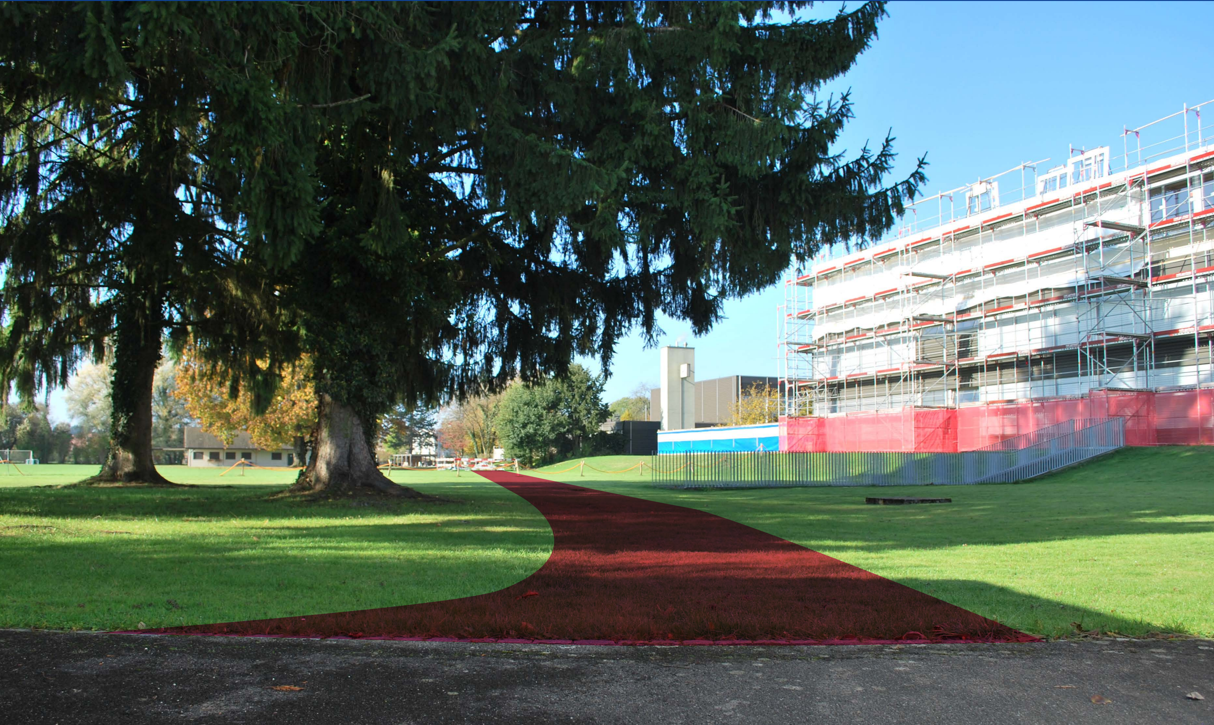
Ein neuer Fuss- und Radweg verbindet die Lerchenfeldstrasse via Finkenweg mit der Sportfeldstrasse.