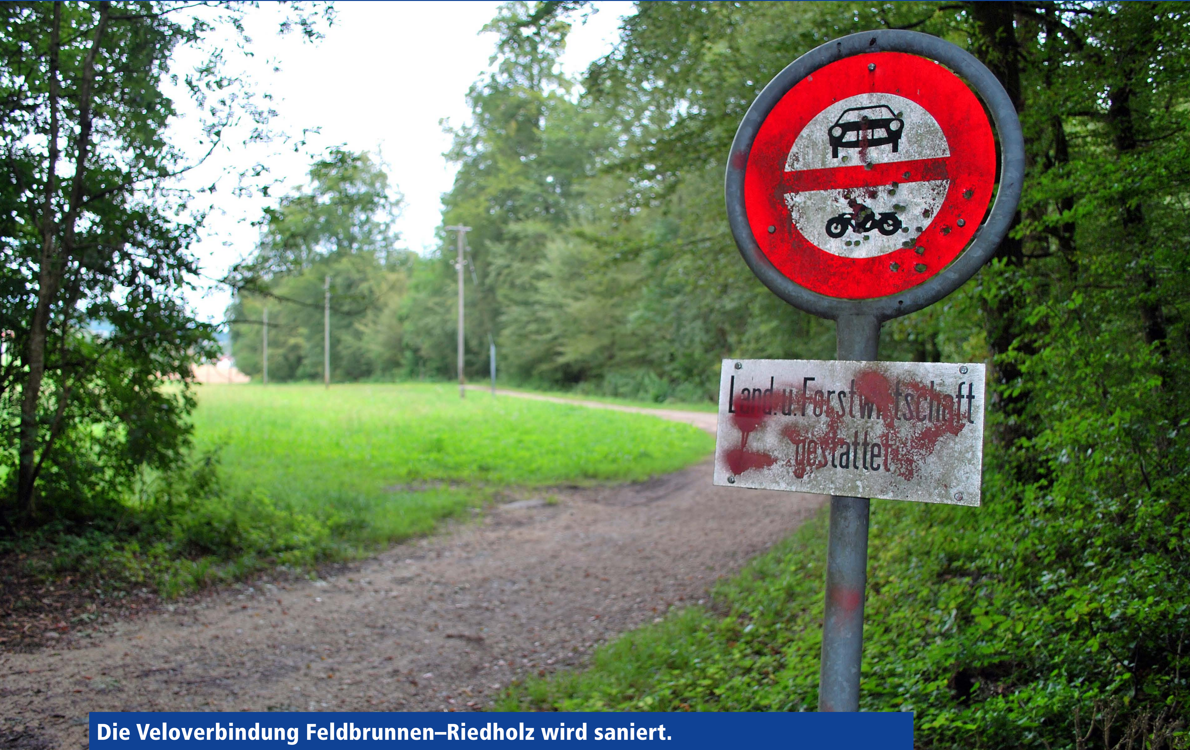
Die Veloverbindung Feldbrunnen–Riedholz wird saniert.